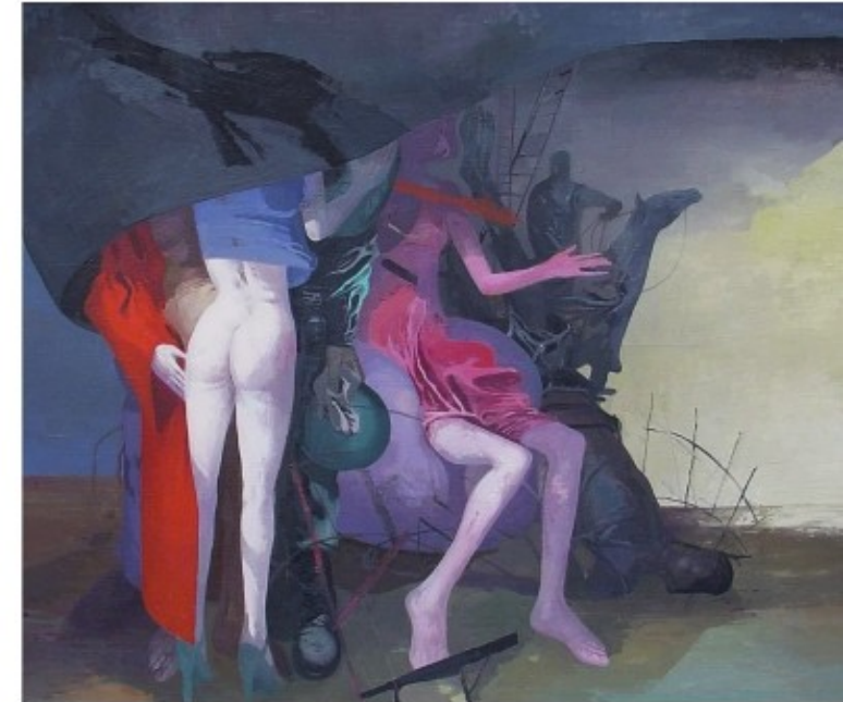
Arno Rink, "Unterm Tuch", Öl auf Hartfaser, 1994, 120 x 140 cm

Leipziger Schule Neue Leipziger Schule und andere Positionen Leipziger Malerei